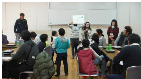
交流会では楽しくクイズ！！

クイズをしたり、生産者へ質問したり、逆に質問されたり、いろいろ盛り上がった交流会になりました。