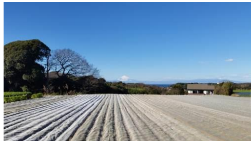
広々した畑のむこうに富士山が！

キャベツ畑では、参加者の親子が包丁で一生懸命切り取っている姿を見て、生産者のご苦労がよく分かりました。