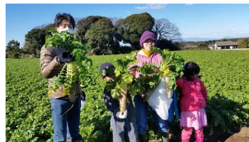
大きな大根がとれました♪