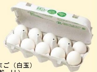
産直たまご(白玉) 10個(MS~LL)