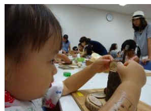
子ども 楽しみ ました♪