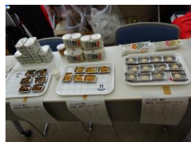
水産加工品や パンやバナナの試食

8月27日(日)に県西エリア初のセンターまつりが小田原駅前のおだわら市民交流センターUMECOで開催されました。試食、販売、絵本の翻訳シート貼り、工作、つみぎあそび、手相コーナーなどなど、盛りだくさんで楽しめました！