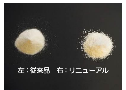
左:従来品 右:リニューアル