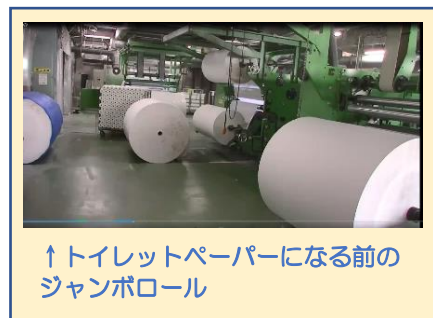
↑トイレトペーパーになる前のジャンボロール