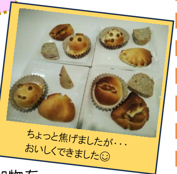
ちょっと焦げましたが... おいしくできました◎