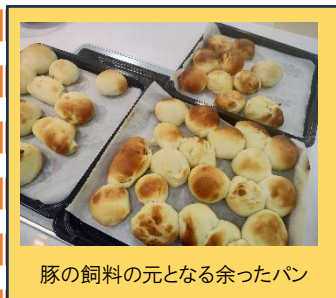
豚の飼料の元となる余ったパン