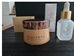
プラセンタ導入美容液と オールインワンジェル