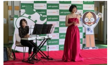
すてきな歌と演奏 《大和市音楽家協会》