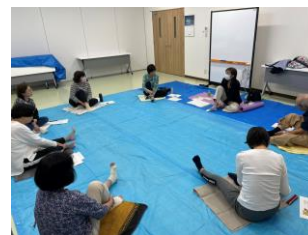
★当日の講座の様子

2023年11月8日(水)に『シニア向け温活足マッサージ』企画を開催しました。下半身全体、特に足の指、足裏のツボと内臓との関係の講座と実際にセルフマッサージを行いました。マッサージでリンパの流れを改善する方法や身体の抵抗力UPに効果的ということを知ることができました。