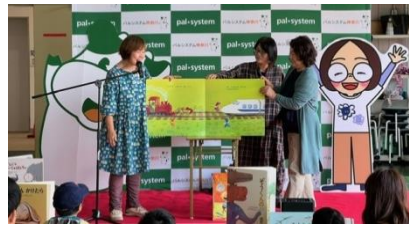
コンサートリーディング 《みんなの絵本のおうち・おはなしの風》