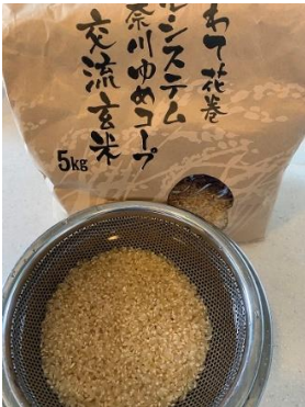
我が家では、久々の玄米