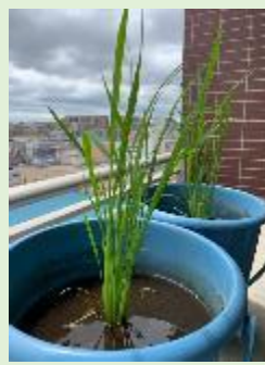
6/20 順調に育ってます