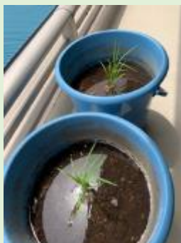
5/17 田植えをしました