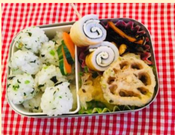
のり・しそ・チーズを くるくる巻いて