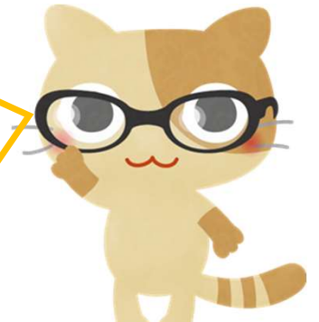
やさしいもずく (三杯酢) 押し

やさしいもずくは、三杯酢もシークワサーも 買ってくれる人が増えてる！！ シークワサー味、多くの人希少価値に気づいたのね！ チラシを見て「買ってみようかな？」って思ってもらえているなら、「押し活」成功です！