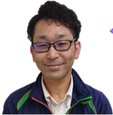
港谷藤沢センター長