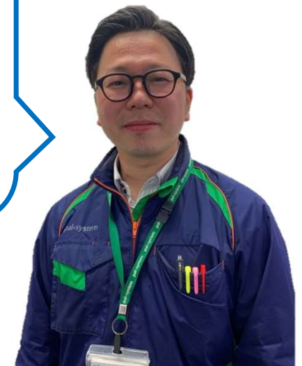
鳥海湘南センター長