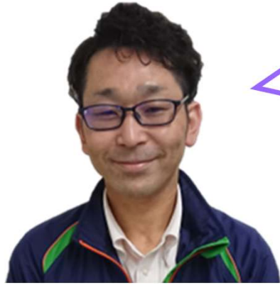
港谷藤沢センター長

ネット投票ではお弁当もずくが人気なんですね～ 冷凍だから保冷剤替わりという点も助かるところ なんですね！ 中華味があるなんて知らなかったです・・・ 恩納村もずくが今回の取り組みで広まったのは間 違いないですね♪